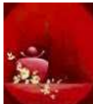
Corinne Collin Bellet Cabinet Ludimédia